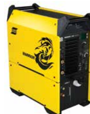
Conjunto Fonte / Unidade de refrigeração Cool2