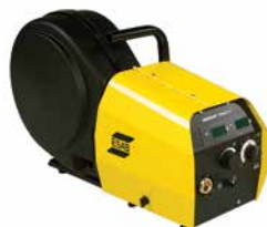
Warrior™ Feed 304W